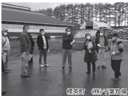
標茶町 (株)千葉牧場

昨年の11月1日から3日にかけて農業委員・農地利用最適化推進委員合わせて19名が視察研修を行いました。