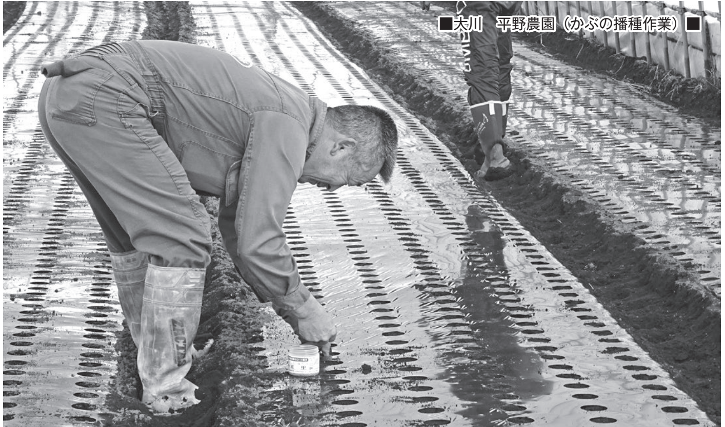
大川 平野農園 (かぶの播種作業)