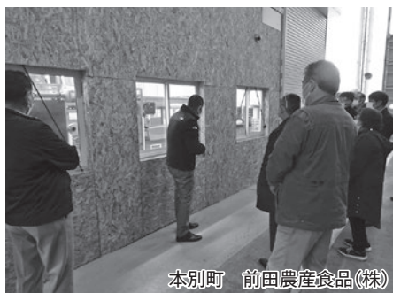
本別町 前田農産食品(株)

今回は、標茶町、釧路市、本別町、上土幌町、鹿追町を訪問し、6次産業化されている法人やバイオガスパラント施設等5か所を視察しました。付加価値を付けるための6次産業化等の現状を知ることができ、当町における6次産業化や今後の農業振興のあり方を学ぶ貴重な機会となりました。