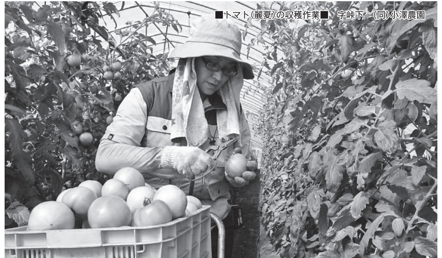
■トマト(麗夏)の収穫作業■ 字峠下 (同)小澤農園