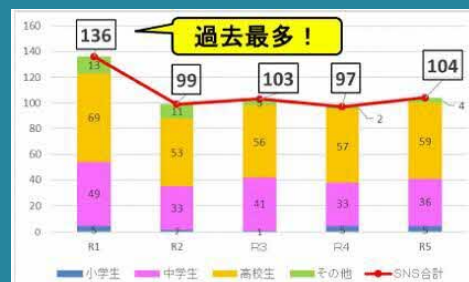
【SNSの利用に起因する福祉犯被害少年の推移】

近年、スマートフォンの急速な普及や所持者の低年齢化が見られ、「自画撮り被害」と呼ばれる児童ポルノ被害が増加傾向にあります。また、SNSを利用したいじめやトラブルも後を絶ちません。