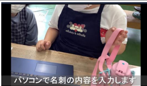
パソコンで名刺の内容を入力します