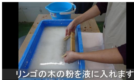
リンゴの木の粉を液に入れます