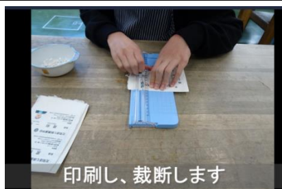
印刷し、裁断します