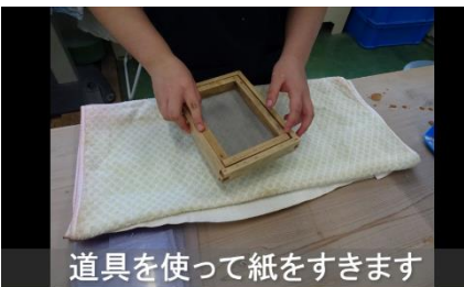
道具を使って紙をすきます