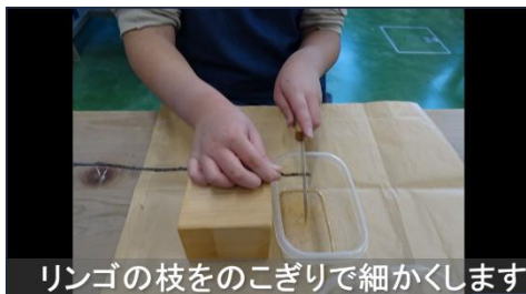
リンゴの枝をのこぎりで細かくします