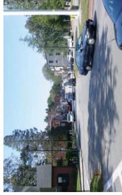
コンコードメインストリート

コンコードの所在するアメリカマサチューセッツ州は北海道と姉妹州になっており、七飯町とコンコードは、同じ北緯42度線上に位置し、気候条件なども似ています。平成5年に七飯町がコンコードを訪問してから交流が始まり、平成9年11月には姉妹都市提携を結びました。コンコードは独立競争勃発の地であり、また多くの文学者が生まれた町としても有名です。平成10年度からはコンコードより国際交流員（OIR）を招き、主に一般市民を対象とした英会話講座や、保育所、七飯高校など各種施設へ訪問を行い、交流を深めています。また、姉妹都市交流の一環として中高生や一般市民を対象に、コンコードへの派遣を行っています。コンコードからも毎年のように生徒や教員グループが七飯町を訪れ、互いにホームステイをして交流が一層深められるものとなっています。